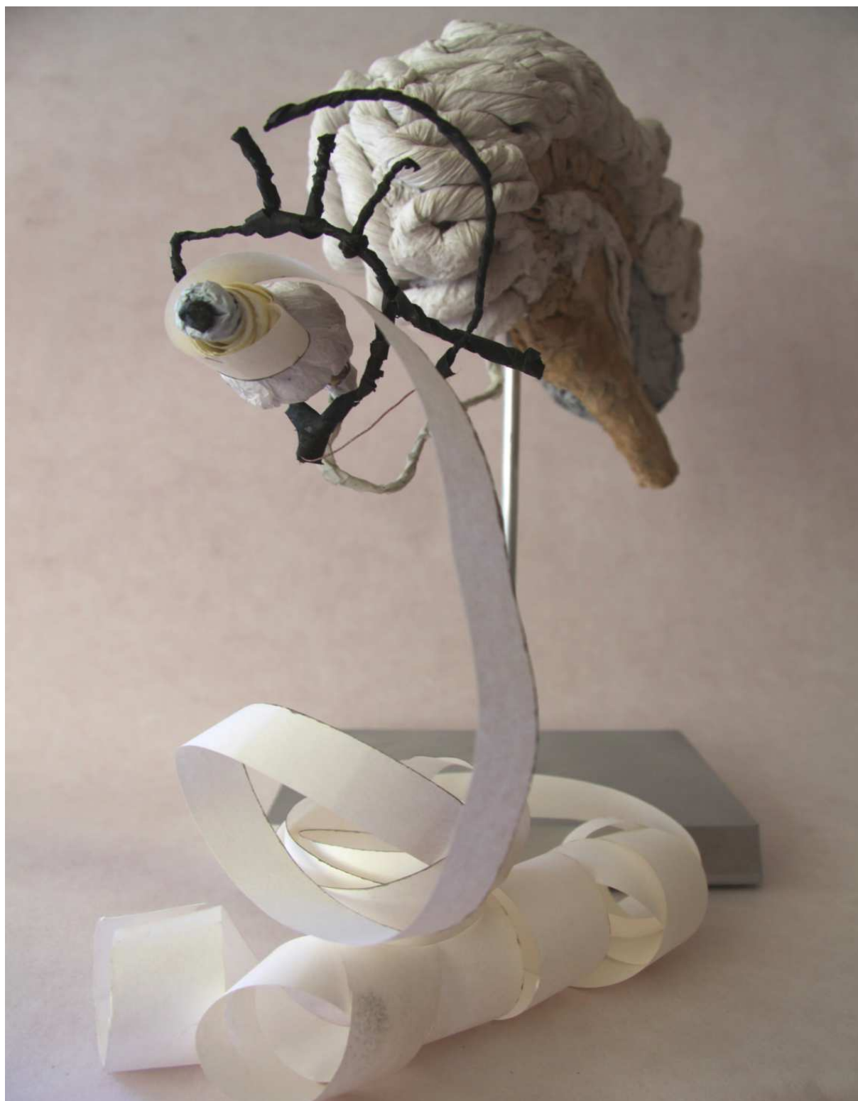
Le cerveau d'un poète